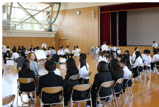
2年生進学ガイダンス