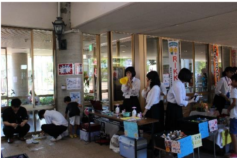
チャレンジショップ「Rikka」