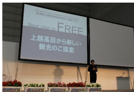
商業クラブ研究発表大会