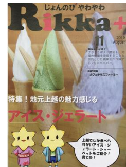
フリーペーパー「Rikka+」発行