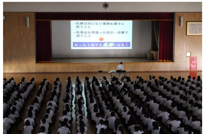
前半は「薬物防止」について