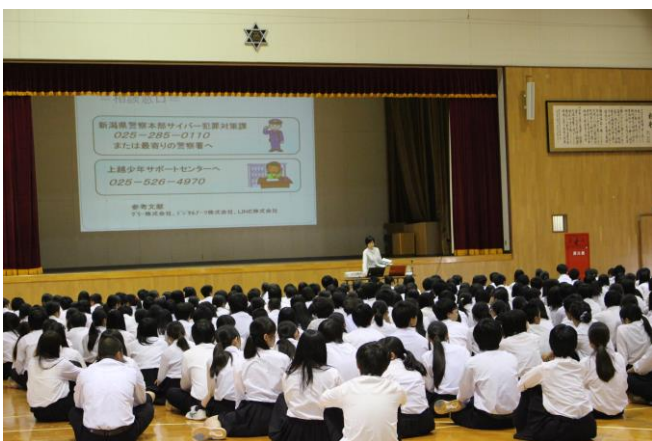
後半は「ネットトラブル」について