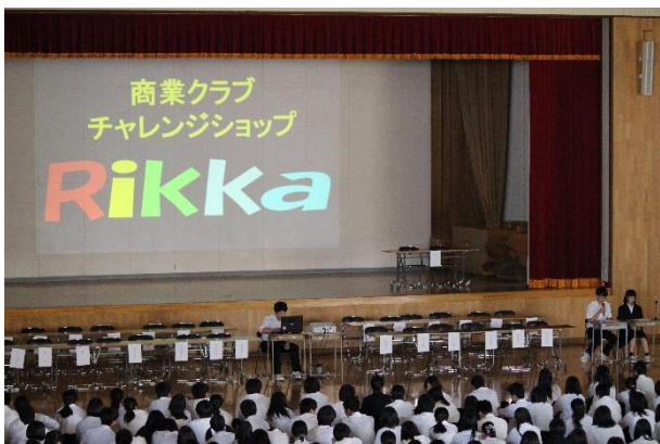
後半は、R i k k a総会を行いました。