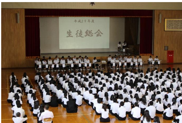
始めに、生徒総会を行いました。

平成29年5月25日（木）生徒総会（前半）、R i k k a総会（後半）を行いました。