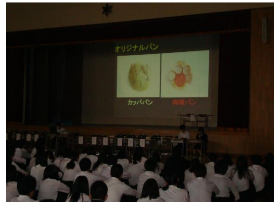
昨年の商品開発などについて説明がありました