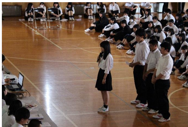
代表生徒による質疑応答