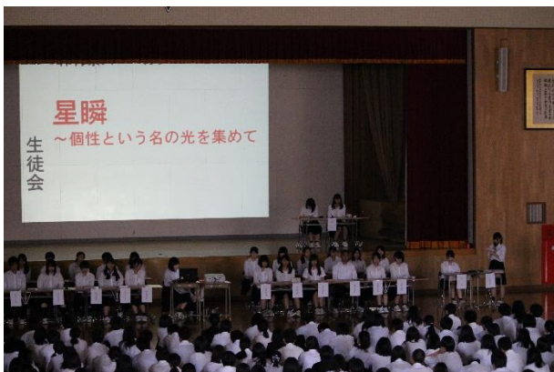
各委員会による活動内容の説明