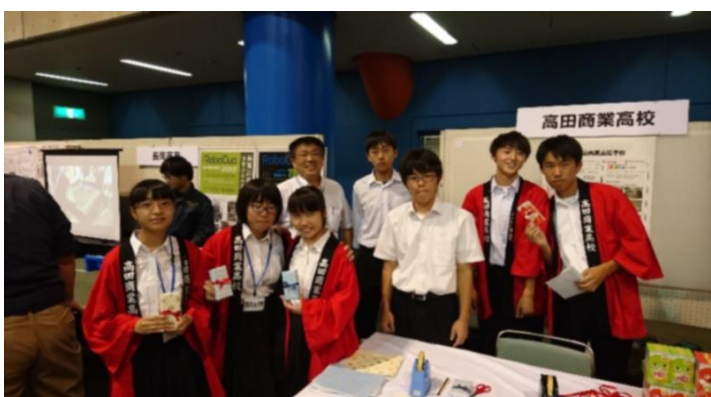
高田商業高校のメンバー。商業高校を紹介するということで、塩沢商工高校と一緒に、中学生にラッピング体験(マーケティングの学習の一部)をしてもらいました。