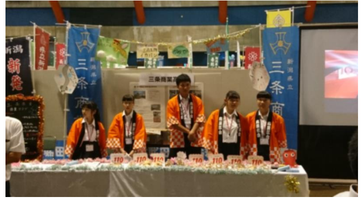
商品企画した「いかパン」を販売した三条商業高校です。