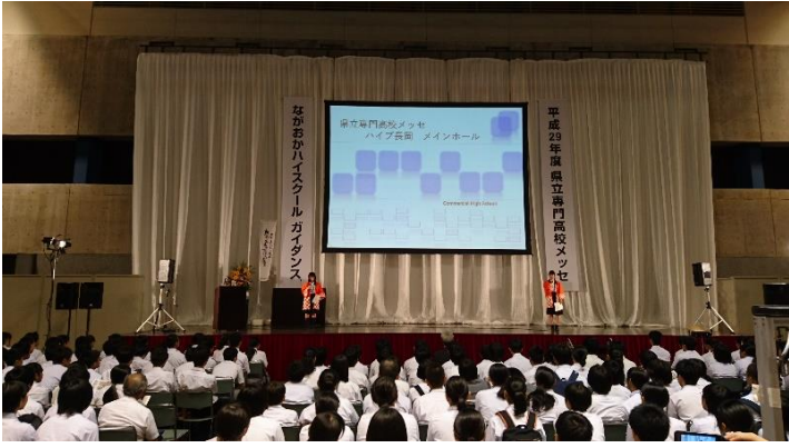
メインステージで行われた商業学科の紹介です。商業高校を中学生にわかりやすく説明してくれました。