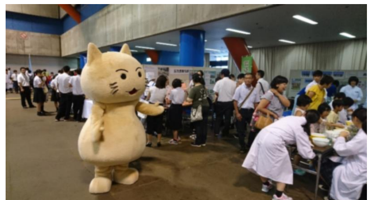
「模擬株式会社 長岡CAT」のキャラクター登場。