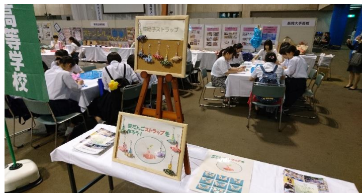
こちらは、笹団子ストラップづくり体験。