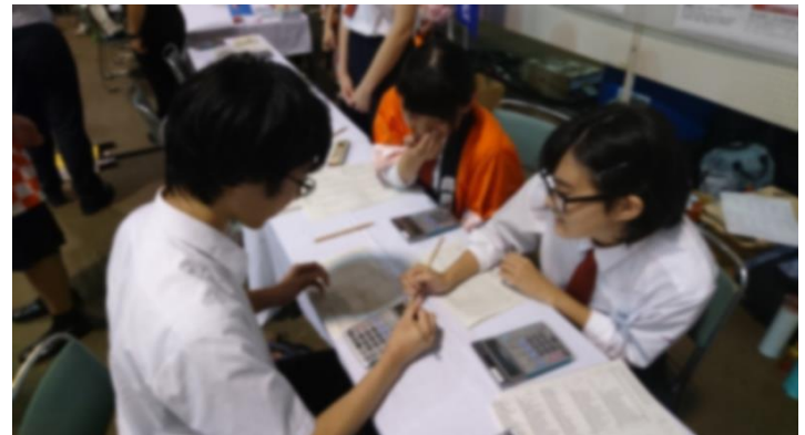
そろばん・電卓の体験コーナーは新潟商業高校です。