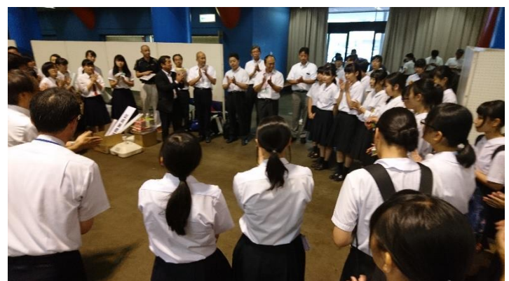
15:30、無事に終了。「チーム商業」の最後は一本締めで終了しました。