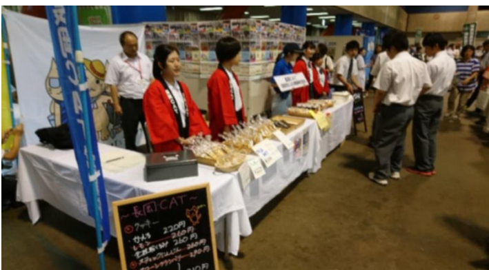
長岡商業・長岡農業・長岡工業の3校が連携して設立した「模擬株式会社 長岡CAT」も出店。