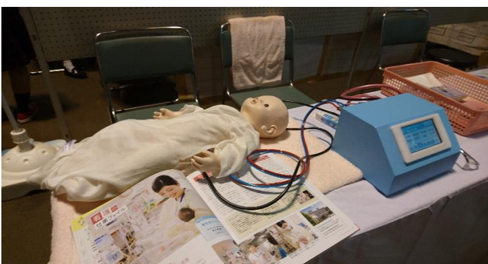
看護・福祉学科は赤ちゃんのダミーを使った実習体験。