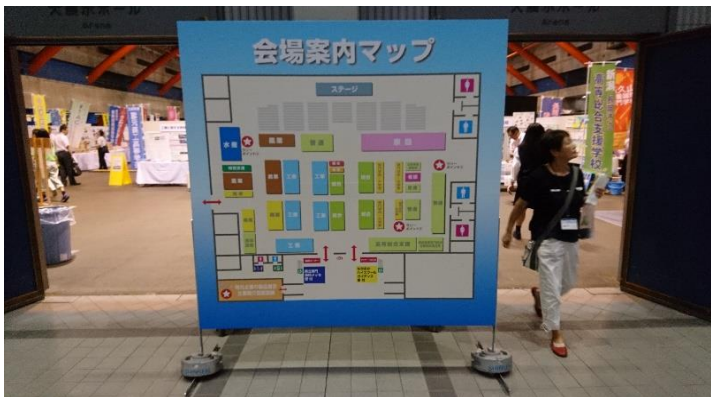
会場入口の案内マップです。