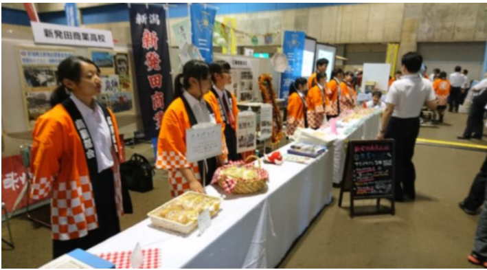
こちらは新発田商業高校です。