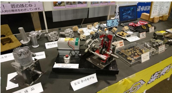
工業高校。中央は卒業作成のエンジン。生徒が1人で、全ての部品作成から組み立てまでを行います。