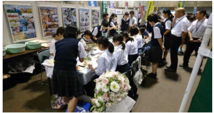
同じく農業高校。こちらは「フラワーアレンジメント」の体験ブース。