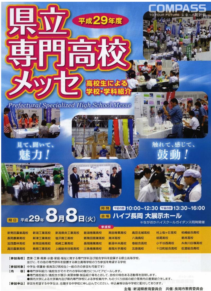
こちらは、専門高校メッセのチラシ(表)です。