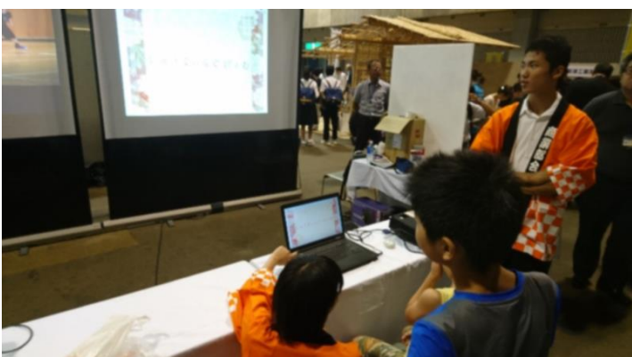
プログラミング体験は長岡商業高校が担当。生徒が作成したシューティングゲームを実演。