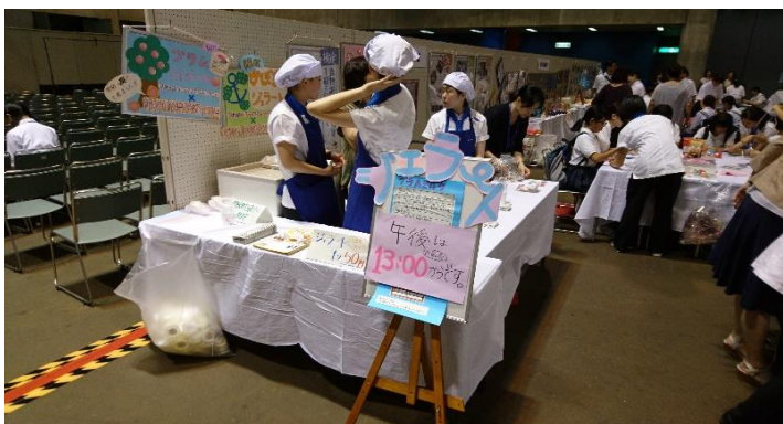
家庭学科はジェラートづくり体験。