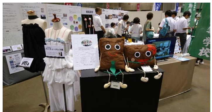
こちらは、総合学科の作品展示です。