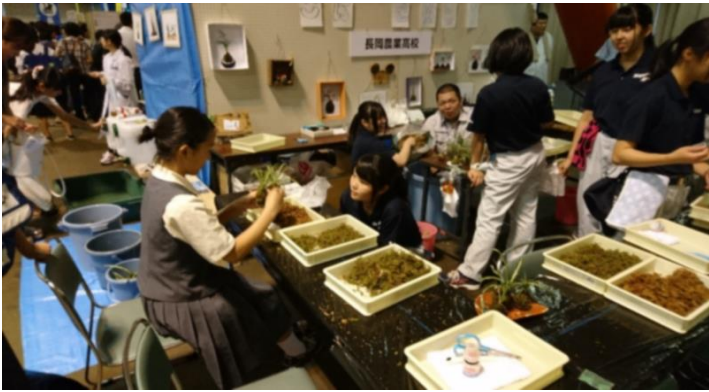
農業高校。こちらは「苔玉づくり」の体験ブース。

※ 専門学科を紹介する県立高校メッセなので、商業以外の専門学科である、農業、工業、水産、家庭、福祉、総合なども体験ブースもありましたので紹介します。