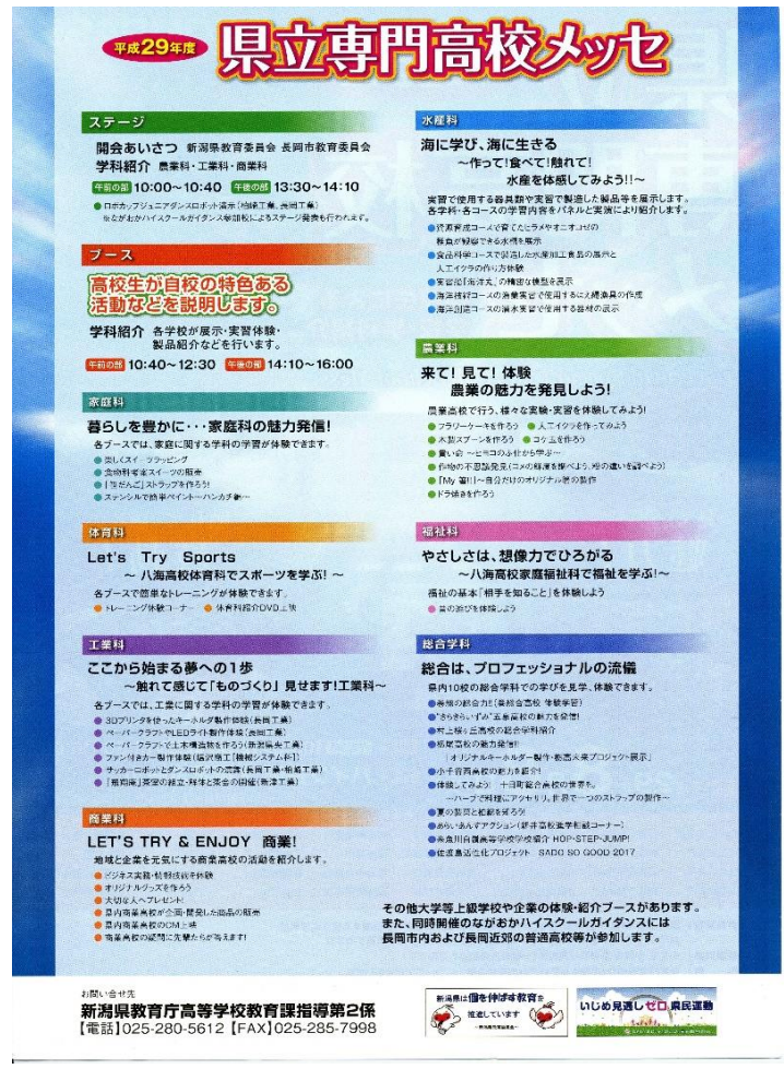
こちら、専門高校メッセのチラシ(裏)です。